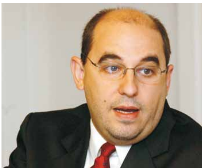
Munhoz: oportunidade de democratizar o conhecimento